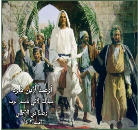
أوصنا لابن داود مبارك الآتي باسم الرب أوصنا في الأعلى (مت ٢١: ٩)